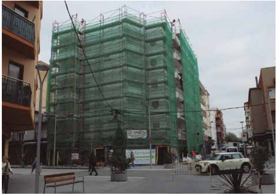
Edifici en rehabilitació a Cambrils.

La ciutat de Barcelona, en particular, ha experimentat un "any particular" amb un creixement del 48% en la superfície visada al tancar el 2023, gràcies a l'impacte dels projectes més significatius. Les 15 obres més grans visades a