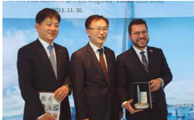
El president Pere Aragonès, durant la visita i reunió amb els responsables de Lotte a Seül.

Aragonès ha remarcat que la inversió de Lotte Energy Materials és "estratègica" per a l'economia catalana i per aquest motiu l'executiu fa "molts mesos" que treballa amb l'empresa coreana i en fa "seguiment diari". "La inversió anirà bé i serà un molt bon exemple per a la resta d'empreses coreanes", ha dit el president. "Quan vegin que una inversió d'aquesta envergadura es produeix a Catalunya i es produeix bé perquè hi ha talent i oportunitats, estem convençuts que darrere en poden venir moltes més", ha afegit.