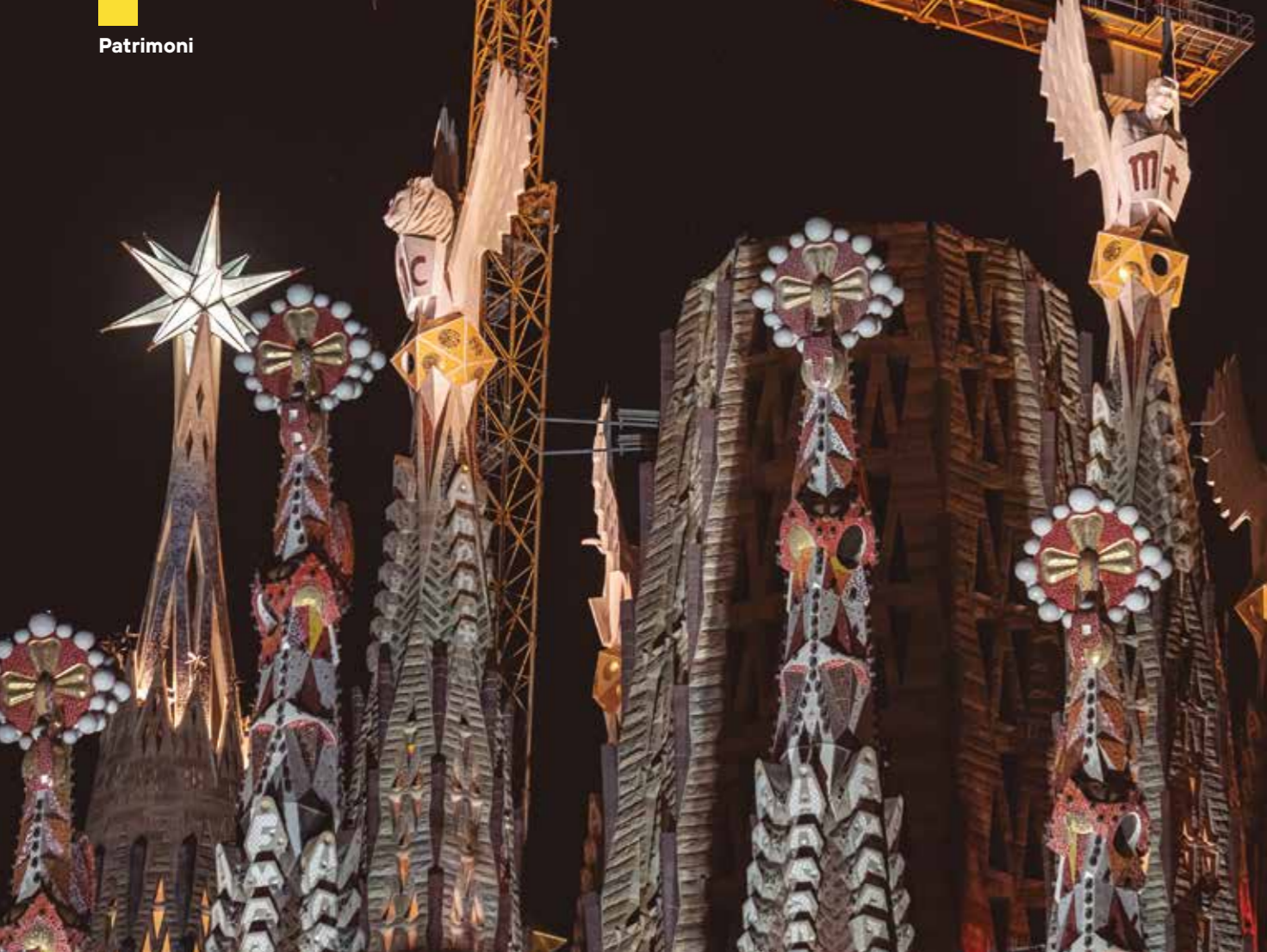
Estrena de la il·luminació de les Torres dels Evangelistes de la Sagrada Família.