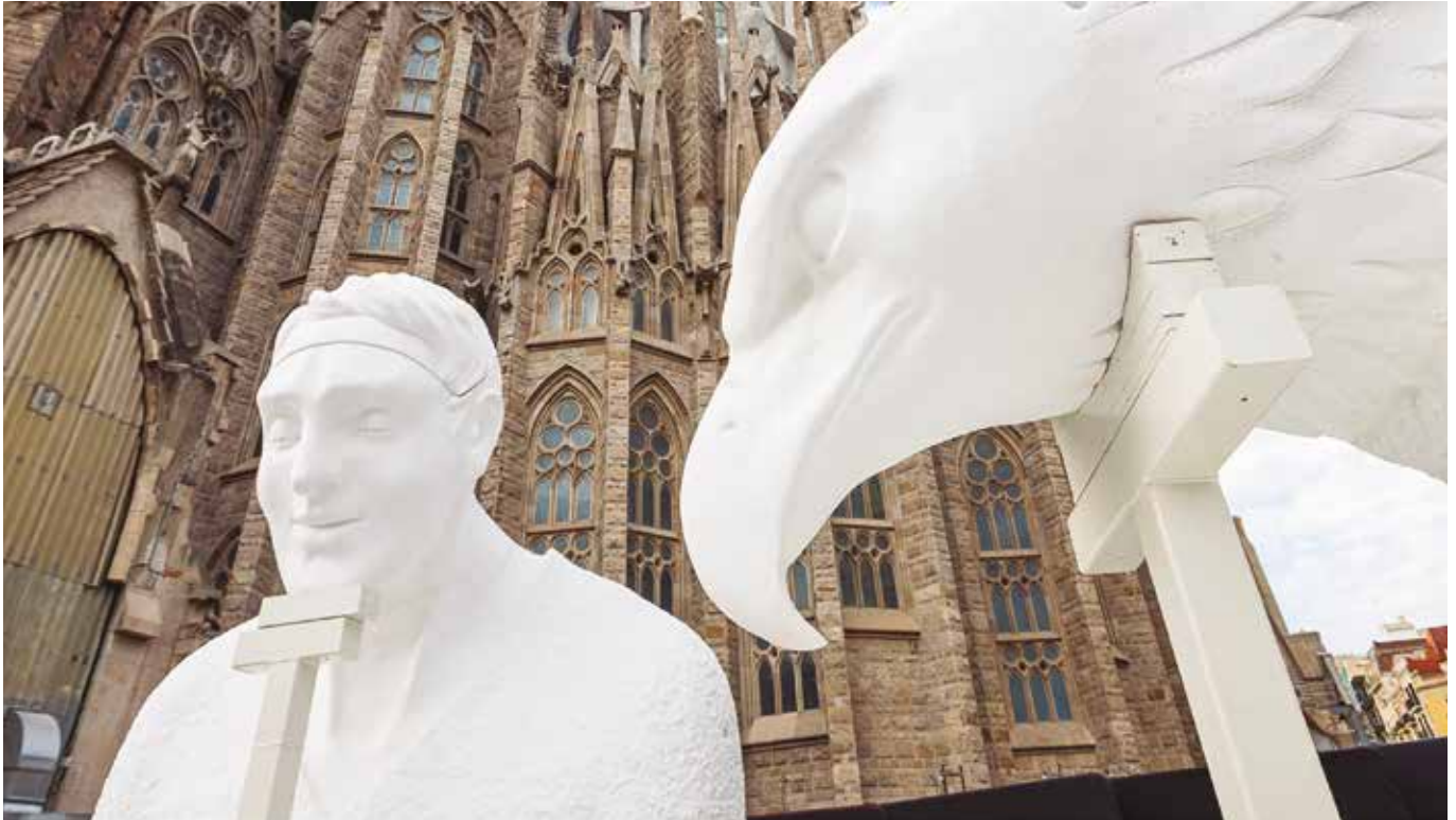
Fotos: Fotografies de la instal·lació a les torres dels Evangelistes de les imatges de Mateu i Joan.

La Junta Constructora del Temple de Gaudí anuncia un nou fons de 2,3 milions d'euros per projectes socials en el desè aniversari