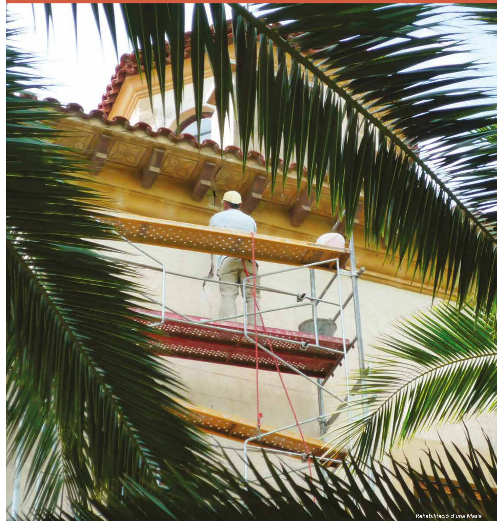
Rehabilitació d'una Masia