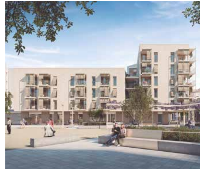
Imatge virtual del futur prpjecte d'habitatge social de la Hispània.

Els diners es destinaran al finançament de les inversions en habitatge social previstes en el projecte