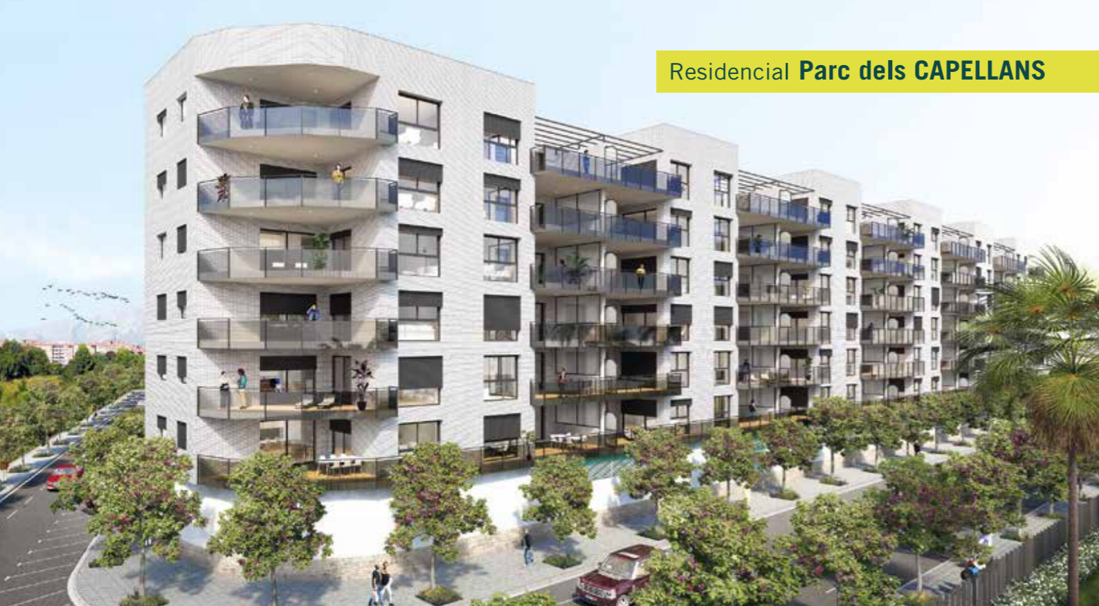
Residencial Parc dels CAPELLANS