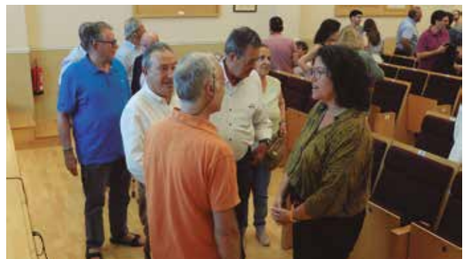
Diverses imatges de la conferència, amb el president del Centre de Lectura, els assistents i la trobada final amb el ponent.

via especulat, coincidint amb el centenari de la mort de Gaudí l'obra no estarà llesta i caldrà esperar encara uns anys més.