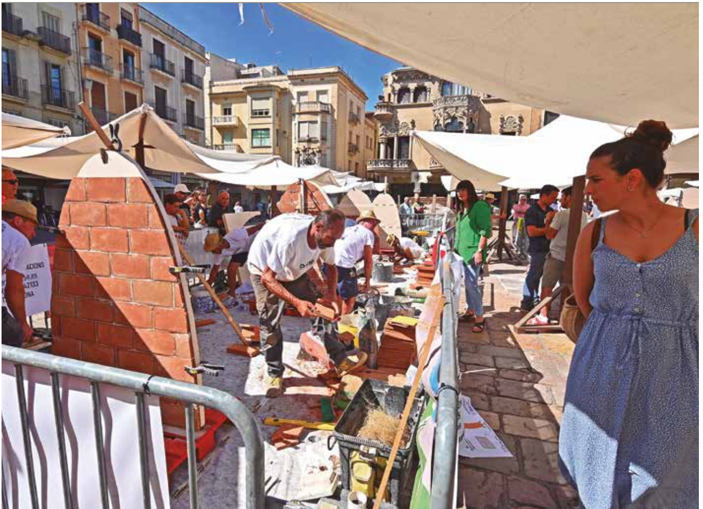
Diverses imatges del Concurs de Paletes que es va celebrar al Mercadal.