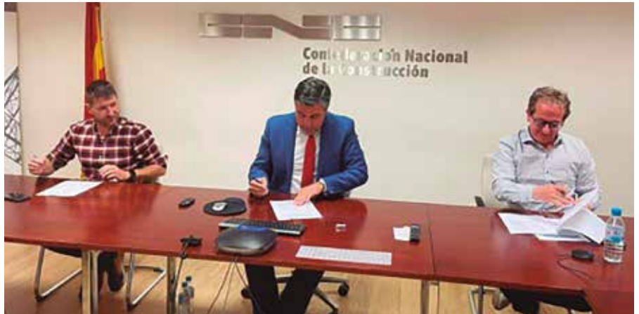
Signatura del conveni entre la CNC i els sindicats majoritaris.

La Confederació Nacional de la Construcció (CNC) i els sindicats més representatius del sector, CCOO de l'Hàbitat i UGT-FICA, van establir, el passat dia 11 de maig, un preacord per a la signatura del VII Conveni General del Sector de la Construcció, que inclou el primer gran pla de pensions col·lectiu sectorial. D'aquesta manera, la construcció serà el primer sector que s'adhereixi als plans de pensions col·lectius promoguts pel Ministeri d'Inclusió, Seguretat Social i Migracions. En aquest context, el dia 19 de maig, el ministre José Luis Escrivá, es va reunir amb el president, vicepresidents i secretària de la Fundació Laboral de la Construcció, Pedro Fernández