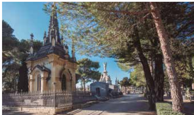
El Panteó Boule al Cementiri General de Reus.

El projecte elaborat pels professors Coll i Costa ha posat de manifest que l'estat de conservació general del Mausoleu Boule és bo i no s'identifica risc estructural que pugui comprometre l'estabilitat de l'edificació. Es van identificar però, alguns processos de degradació que amb la intervenció prevista es solucionaran. Aquests afecten sobretot a l'exterior del mausoleu, on es poden observar alguns petits desprendiments, especialment en les parts superiors dels pinacles, la cornisa i algunes decoracions florals. El grau de porositat elevat de la pedra utilitzada en la construcció també ha afavorit la penetració d'humitats i per tant l'erosió i l'embrutiment per l'existència de plantes, líquens i molses. També es va observar l'alteració d'alguns elements a nivell cromàtic. Aquest fet no s'ha enregistrat com a una patologia, donat que no atempta contra la durabilitat del material, però s'ha tingut en compte a l'hora de definir les actuacions de neteja. Respecte a