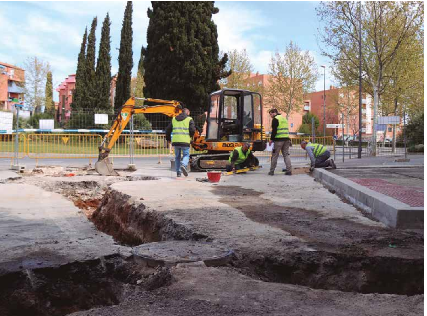
Treballadors d'una empresa, a una obra pública a la ciutat de Reus fa unes setmanes.

El sector considera negativa la inacció de l'administració catalana, la provincial i la local, a diferència del govern estatal, per assumir mesures efectives que facin front a l'escalada de preus i que, per ara, no es poden revisar