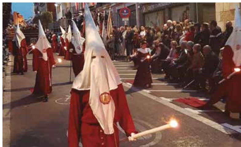
Diverses imatges del pas, els portadors del Guió infantil, els portadors de l'estandard i els acompanyants.