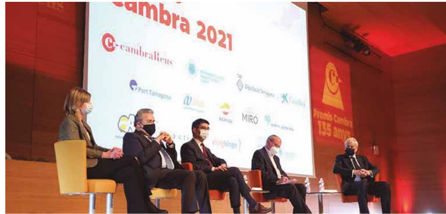
Diverses imatges de l'acte de celebració dels Premis Cambra 135 anys.

de la Fundació FP Empresa; a més de la promoció de productes agroalimentaris, amb especial atenció a la creació de la Farina de Mestral, el projecte que acompanya la Cambra en col·laboració amb el Gremi de Forners de Reus i el Baix Camp, l'Agropecuària Coperal de Santa Coloma de Queralt i la Farinera Poquet d'Ascó.