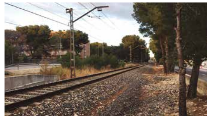
Imatge de l'antic traçat ferroviari de la costa, al seu pas per Miami Platja.

Els treballs tenen un pressupost 1,8 milions d'euros i un termini d'execució d'un any