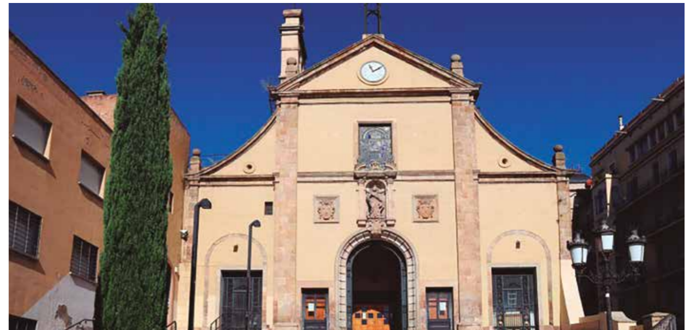
Sant Rafael de la Selva del Camp (imatge superior) és clònica dels Josepets de Gràcia, a la plaça Lesseps de Barcelona, totes dues començades el 1658.

Seguint el principi de firmitas, les obres de fra Josep de la Concepció només desapareixen quan les aterra la mà de l'home. Aquest va ser el trist destí de l'església que hi havia a la plaça del Prim de Reus, al lloc del teatre Fortuny, idèntica a les de les fotos d'aquest article. La va enderrocar la revolució gloriosa del 1868. El castell de Botarell,