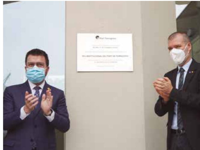
Pere Aragonès, president de la Generalitat de Catalunya, durant la inauguració de la seu institucional del Port de Tarragona.

Tot seguit, el president Aragonès van visitar un dels magatzems de cereals situats en l'interior del port per interessar-se