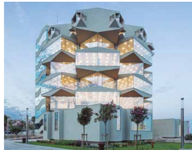
Edifici de la Seu Institucional del Port de Tarragona.

Ara el renovat edifici de l'APT acull les oficines de presidència (a la 4a planta), de la direcció general, de la secretaria general i serveis jurídics i la direcció de comunicació i imatge (totes tres a la 3a planta). A més, la 5a planta s'ha destinat per acollir la seu de Salvament Marítim i de la nova Sala de Gestió d'Emergències, entre altres espais. I la 6a planta es troben els serveis de control de navegació i seguretat marítima, integrats per PortControl i Salvament Marítim. Les plantes 1 i 2 se cediran en règim de concessió a entitats o empreses.