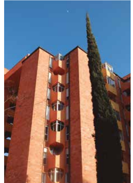
Imatges d'arxiu del Barri Gaudí de Reus, que el 2018 va celebrar els seus primers 50 anys.

L'arquitecte i urbanista Ricardo Bofill va morir als 82 anys aquest mes de febrer. Nascut a Barcelona el 1939, se'l considera un dels urbanistes catalans més influents i reconeguts de l'àmbit internacional. Es va formar a l'Escola Tècnica Superior d'Arquitectura de Barcelona (ETSAB), que el va nomenar doctor 'honoris causa' el setembre passat. Bofill va impulsar un miler de projectes en una quarantena de països, com l'Hotel Vela, el Teatre Nacional de Catalunya o la terminal 1 de l'aeroport, el parque Manzanares de Madrid, la seu corporativa de Shieido Ginza o la de Cartier a París. Sens dubte a Reus és molt