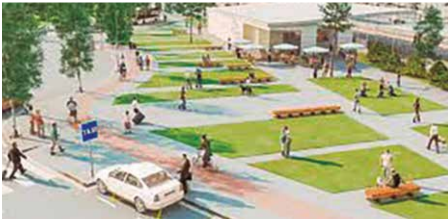
Imatge virtual de la futura estació de ferrocarril de Bellissens.

Adif anuncia l'adjudicació del contracte de serveis i assistència tècnica per la redacció del projecte bàsic i de construcció de la futura estació