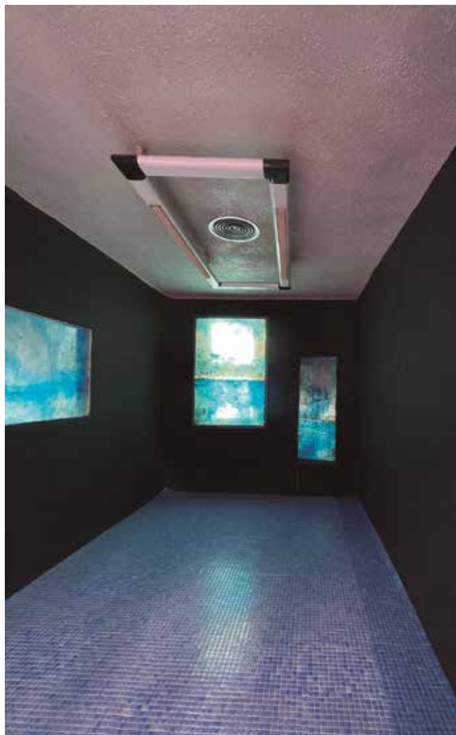
Imatges de dues de les intervencions dels artistes que van participar en el projecte 'l'art que transforma'.

La revitalització estratègica dels dos ravals està basada en la metodologia de reactivació d'espais comercials buits «Espais en Transició», creada i dissenyada per bbintervencions, consultora estratègica guanyadora del Premi Nacional d'Artesania 2019 en la categoria «Impulsa» pel resultat del projecte Espais en Transició Vic, que ha reactivat 22 locals buits del Carrer de la Riera d'aquesta ciutat, convertint-los en botigues taller artesanes i altres negocis singulars i artístics. A Reus, el projecte Espais Buits ha comptat amb la participació d'una vintena d'artistes de la comarca que van treballar en els aparadors. Cadascun dels divuit aparadors se centrava en un concepte relacionat amb una problemàtica mediambiental o social. I és que l'exposició venia inspirada