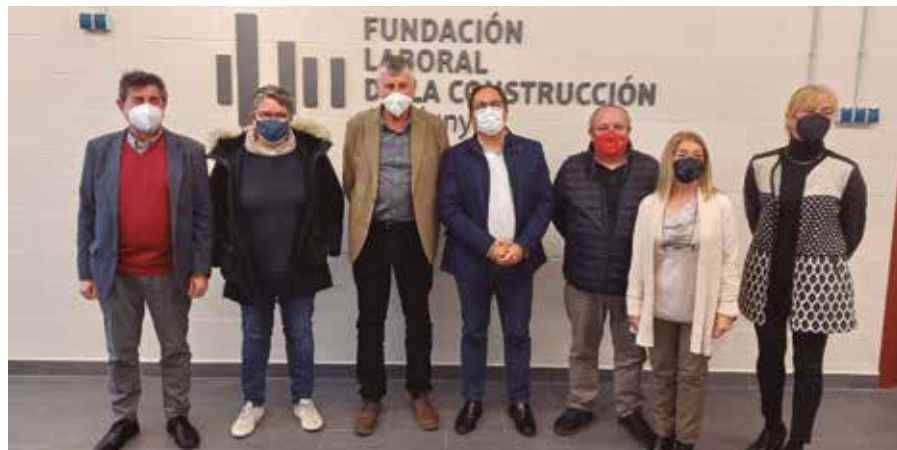
Imatge de la visita i la recepció del secretari general de Treball, a la FLC de Catalunya.

Ambdues institucions s'han compromès a buscar sinergies i continuar amb acords de col·laboració en benefici de les empreses i les persones treballadores del sector