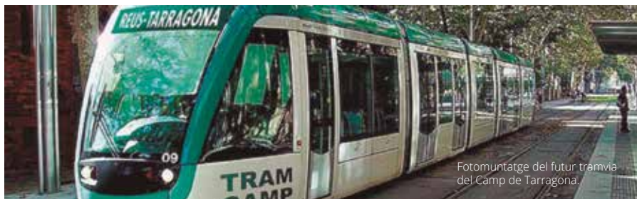
Fotomuntatge del futur tramvia del Camp de Tarragona.

La segona fase del projecte és la que ha de permetre unir Reus i Tarra-