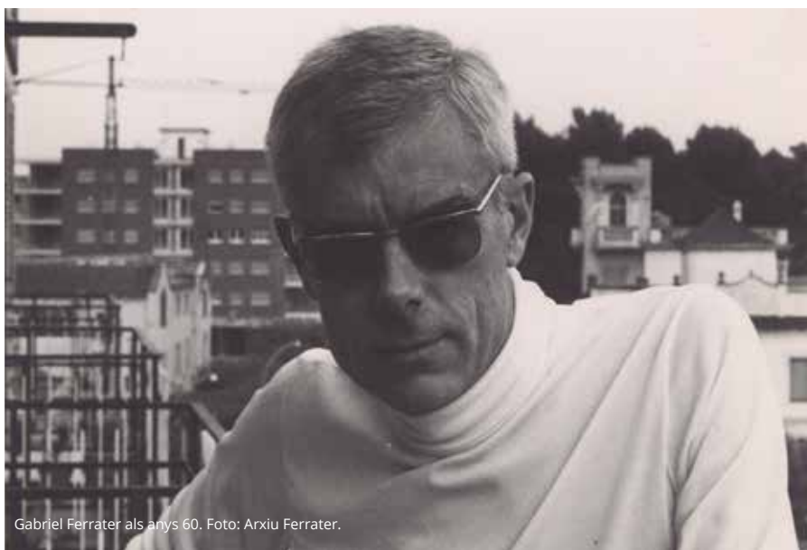
Gabriel Ferrater als anys 60.