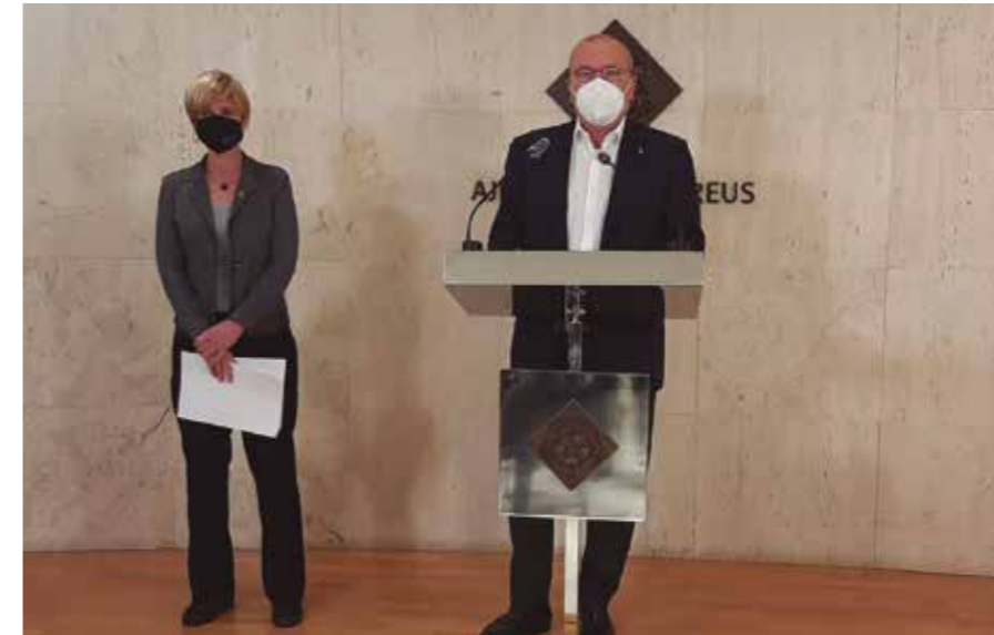
L'alcalde Carles Pellicer, acompanyat de la vicealcaldessa Noemí Llauredó.

Tindrà com a prioritats el foment de l'ocupació, l'impuls de l'emprenedoria i el desenvolupament econòmic, i l'ajuda als col·lectius més vulnerables