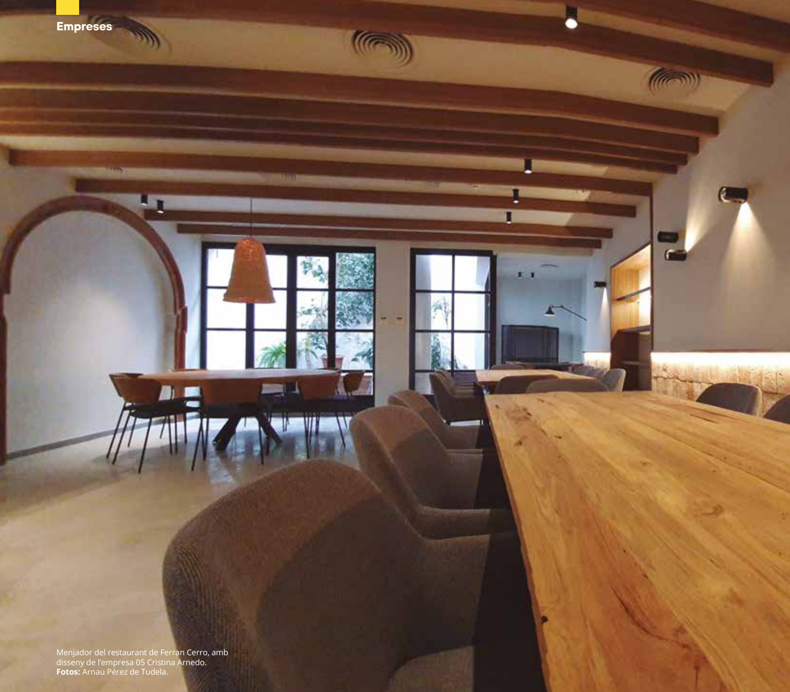
Menjador del restaurant de Ferran Cerro, amb disseny de l'empresa 05 Cristina Arnedo.