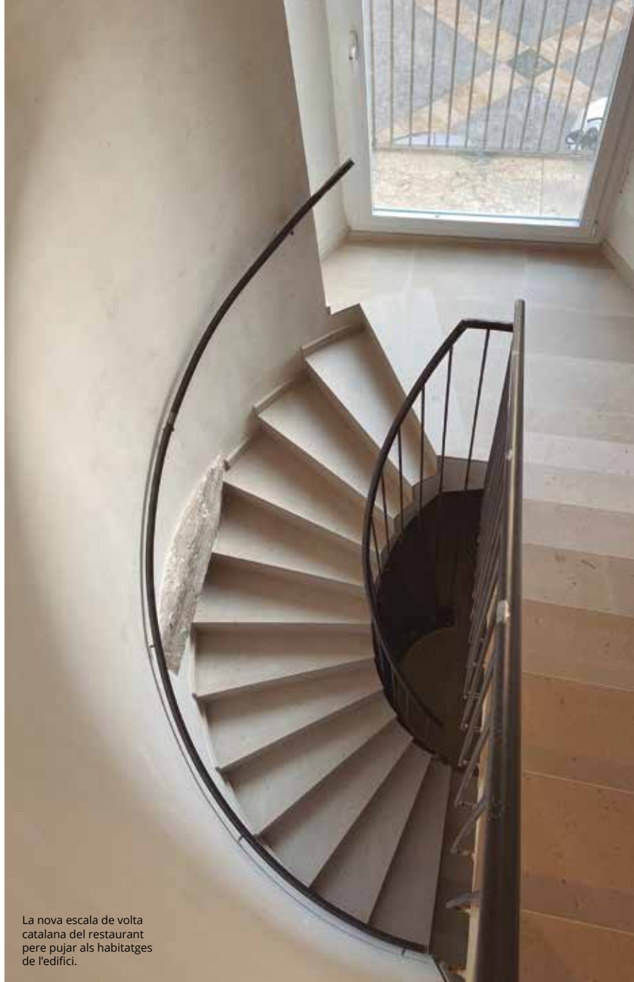
La nova escala de volta catalana del restaurant per pujar als habitatges de l'edifici.

Il·luminositat i amplitud; el nou restaurant ha modificat sensiblement la distribució de l'antic restaurant de la Glorieta del Castell per permetre l'accés directe als habitatges situats a les 2 plantes superiors, sense haver de passar per l'interior de l'establiment i l'adaptació de l'activitat a les noves exigències de la normativa actual al sector de la restauració en matèria de seguretat i lluita contra incendis.