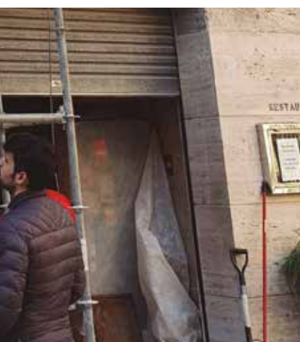
Una imatge del procés constructiu de la façana.

la plaça del Castell, tant per aquest nou habitatge com pel que hi ha al pis superior. Aquest accés independent s'ha aconseguit aprofitant una obertura en planta baixa donava llum al darrera de la barra del restaurant. Des d'aquesta entrada s'accedeix amb una escala compensada fins al nivell de la planta primera, i a partir d'aquí, i amb una escala d'un tram, enllaça amb el nucli d'escala actual que ens porta fins a les plantes segona i tercera.