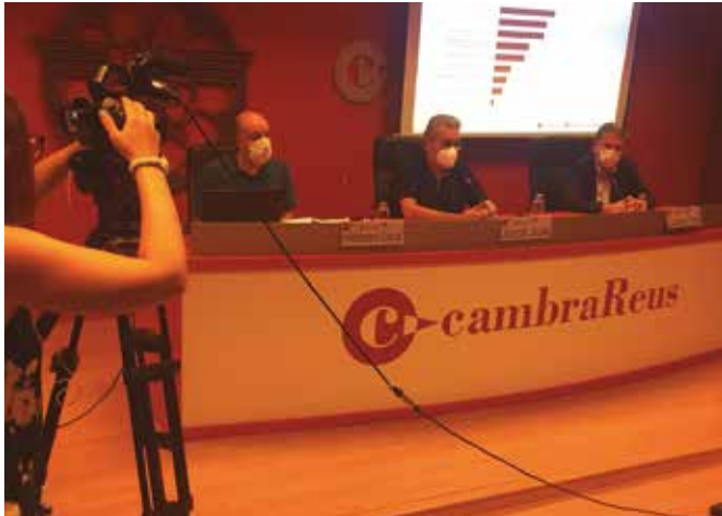
Imatge de la presentació del darrer Radar Cambra

Les empreses que consideren que la situació és dolenta o molt dolenta passen del 19% al 54%, tot i que creixen les que creuen que la conjuntura millorarà en un any