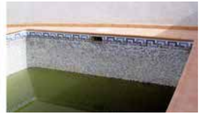
BUIDAT DE PISCINA