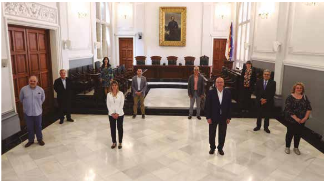
L'alcalde de Reus, acompanyat de representants de tots els partits, i membres de la societat civil, durant la presentació del nou pla Reactivem Reus.

La previsió del consistori reusenc és invertir 700.000 euros en obres que ajudin a recuperar el sector de la construcció