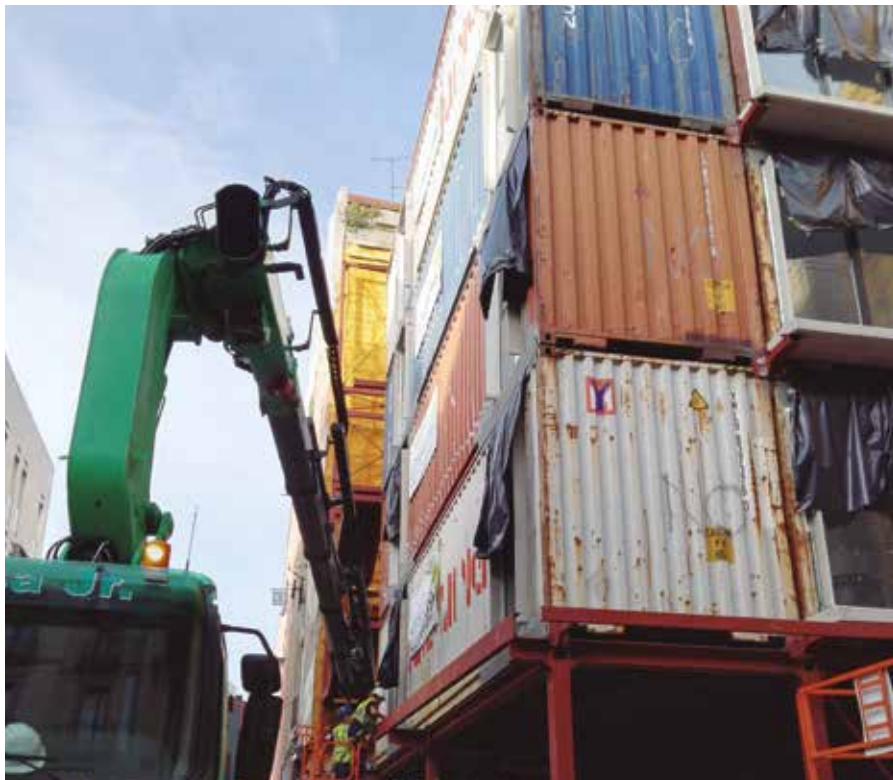
Edifici a partir de contenidors marítims, construït per Constència SL, al Gòtic de Barcelona

Al nostre país, més del 70% dels edificis són d'abans de l'any 1980 i no compleixen amb els estàndards d'aïllament ni de sostenibilitat establerts per la Unió Europea