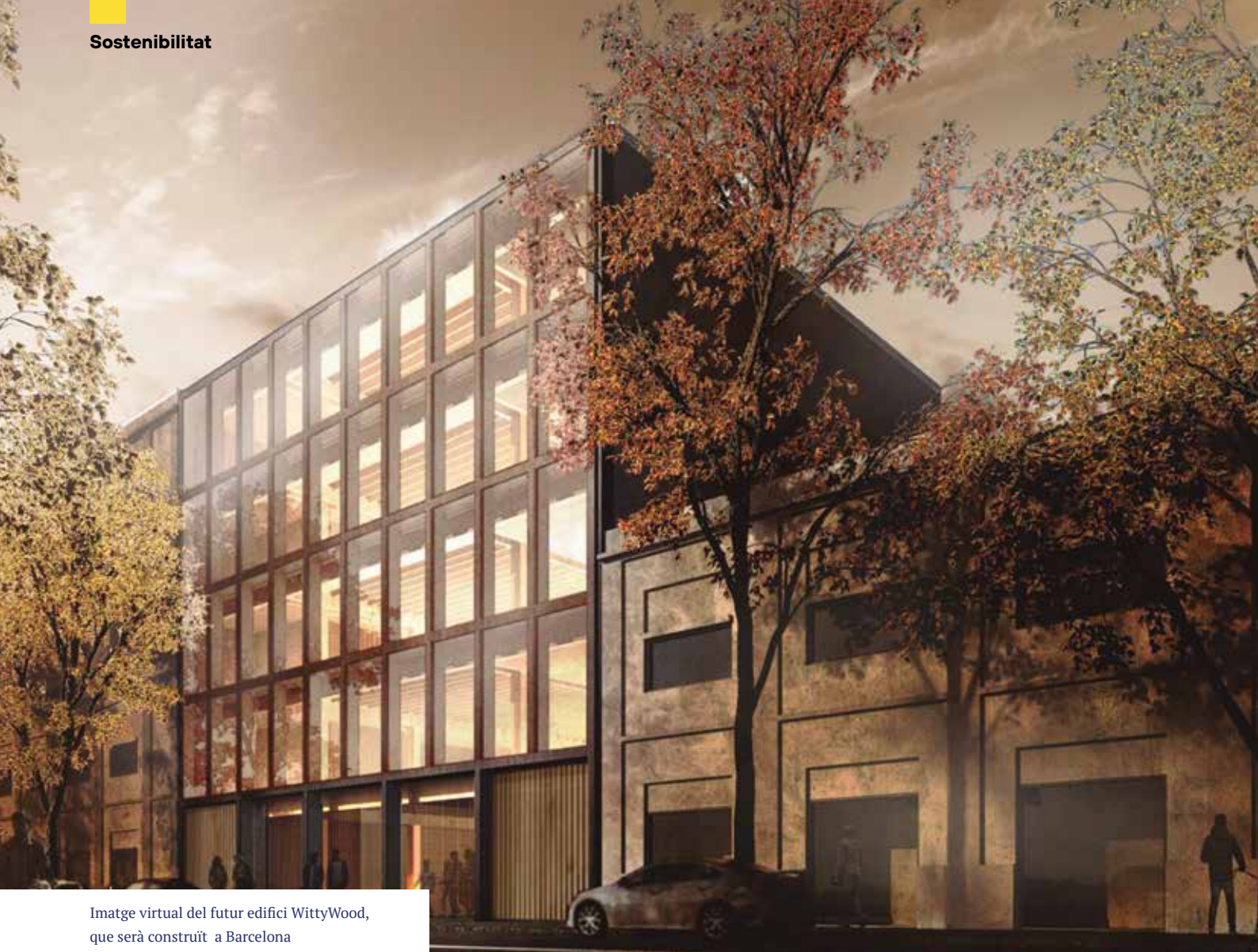
Imatge virtual del futur edifici WittyWood, que serà construït a Barcelona