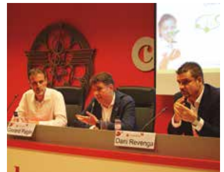
La jornada tècnica es va celebrar a la Cambra.

el fantasma de la inseguretat jurídica, ja que aquest cop això no té enrere: el marc regulador de l'energia fotovoltaica serà estable".