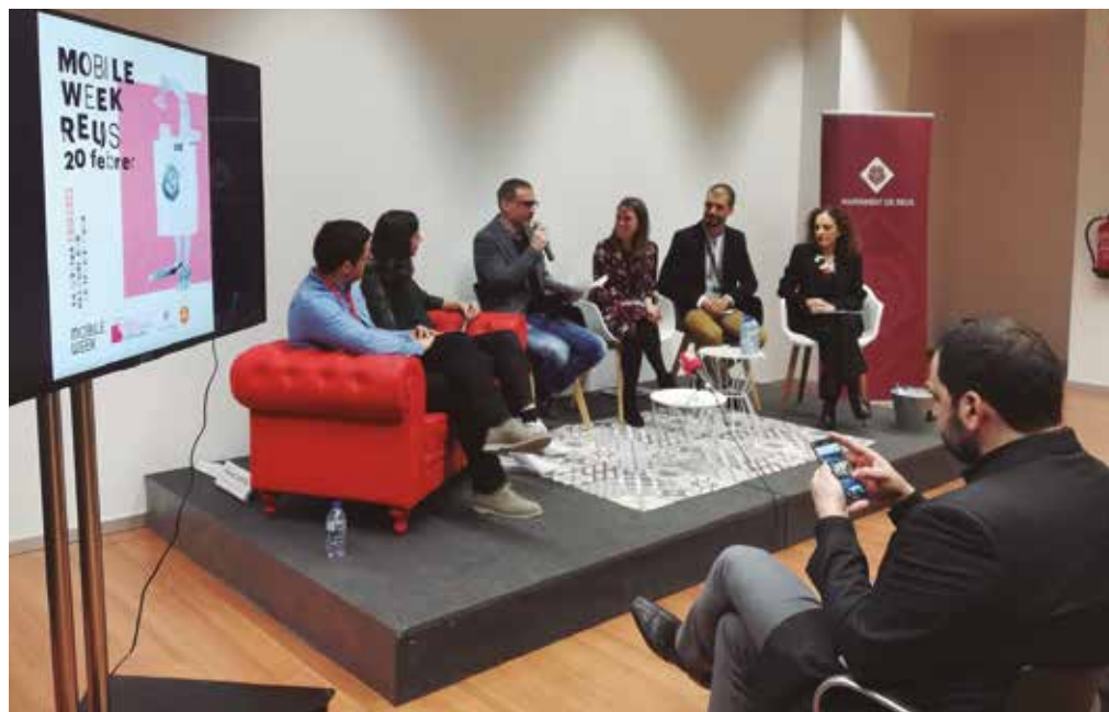
Fotografia de la primera edició de la Mobile Week Catalunya l'any passat a Reus

La Mobile Week Catalunya se celebra la setmana prèvia al Mobile World Congress, que es realitza del 24 al 27 de febrer a Barcelona