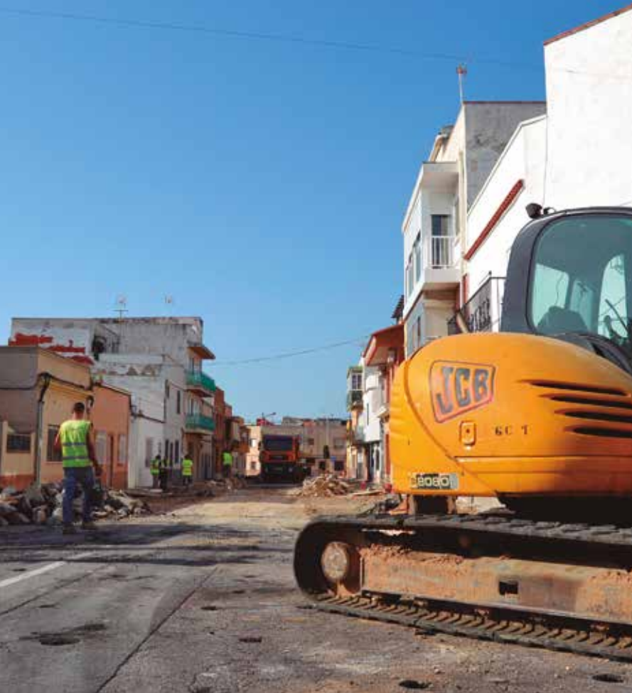
Obres de reforma al carrer Roger de Llúria al barri Sol i Vista