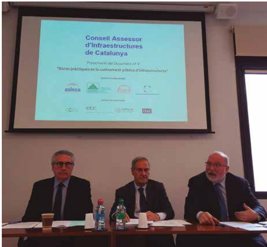
Presentació de l'informe sobre Bones pràctiques en la contractació pública d'infraestructures

El consell assessor d'infraestructures defensa que cal desenvolupar les potencialitats de la llei actual per aconseguir una contractació basada en la qualitat, no només amb criteris econòmics