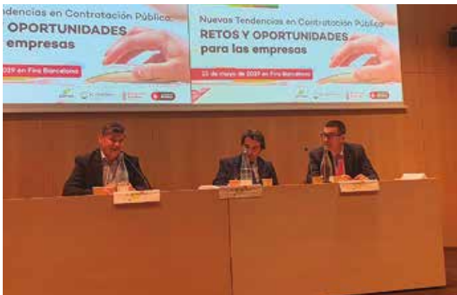
Ponents a la Jornada de Pimec a BBConstrumat