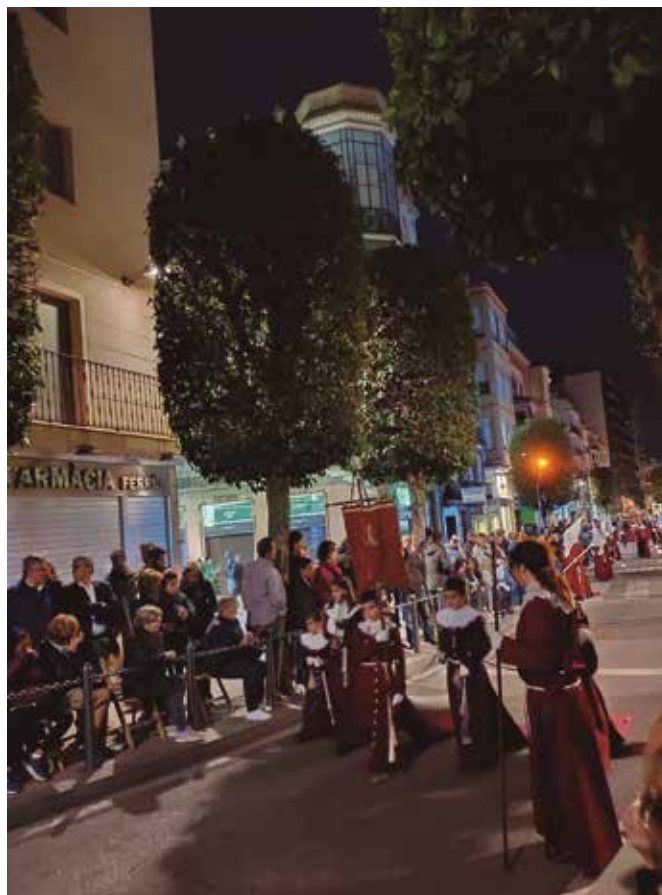
Recull d'imatges de la darrera edició de la Setmana Santa a Reus