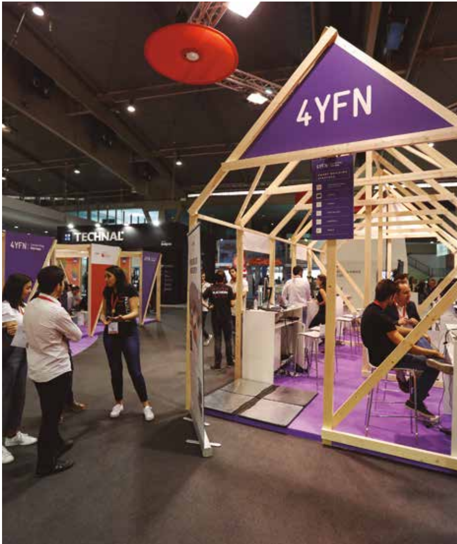
Edició del BBConstrumat 2018.

L'Institut de Tecnologia de la Construcció de Catalunya (ITeC) organitza The BIM Spot