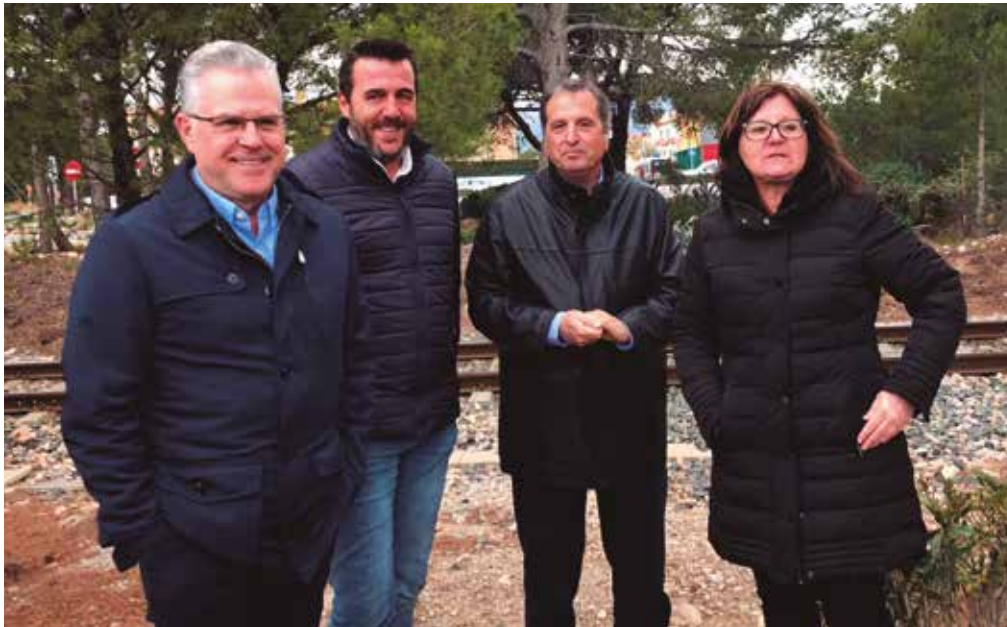
Els alcaldes afectats per la via de la costa, Salou, Vandellòs-l'Hospitalet, Mont-roig del Camp i Cambrils, en una roda de premsa conjunta de la passada primavera.

L'Ajuntament encarrega un estudi per resoldre la mobilitat a la zona que s'alliberarà de les vies