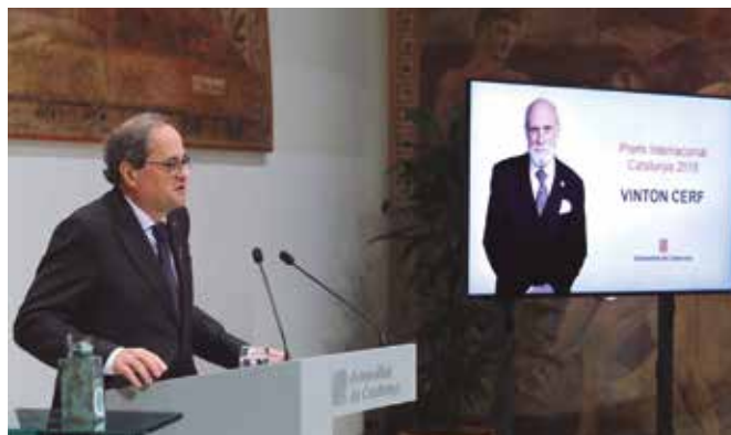
El president Quim Torra, durant l'anunci del premi a Vinton Cerf.

El Premi Internacional Catalunya és atorgat anualment per la Generalitat de Catalunya per distingir aquelles persones que han contribuït decisivament amb el seu treball creador a desenvolupar els valors culturals, científics o humans arreu del món. Enguany havien concorregut 109 candidatures provinents de 50 països. El president lliurarà el premi a Cerf en el decurs d'una cerimònia que tindrà lloc el pròxim 25 de març, al Palau de la Generalitat.