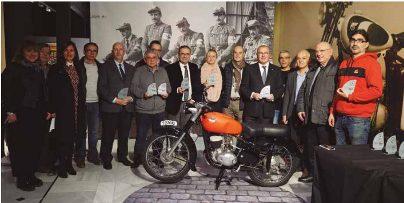
Les autoritats al Museu de Reus, al costat d'una de les diverses peces de l'exposició.

La mostra, que s'ha pogut veure al Museu de Reus, formava part dels actes del centenari del Foment Industrial i Mercantil