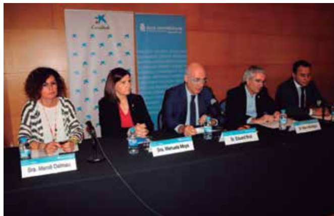
Participants de la Jornada de l'APCE a Vila-seca

L'APCE es mostra convençuda que la inversió de Hard Rock i la creació de 10.000 llocs de treball directes -a part d'indirectes- comportaran una notòria demanda habitacional arran les