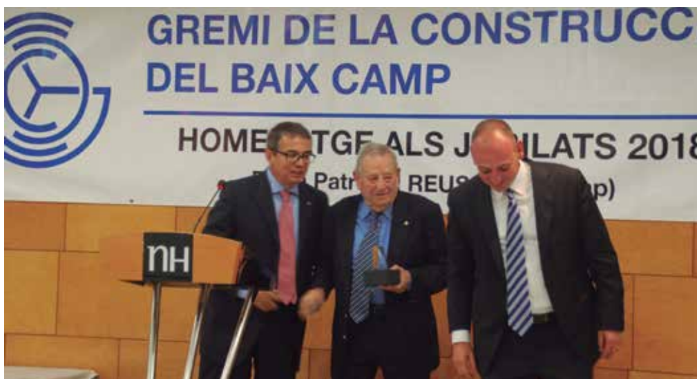
Els homenatjats i les seves esposes, en el transcurs del sopar del Gremi de la Construcció del Baix Camp