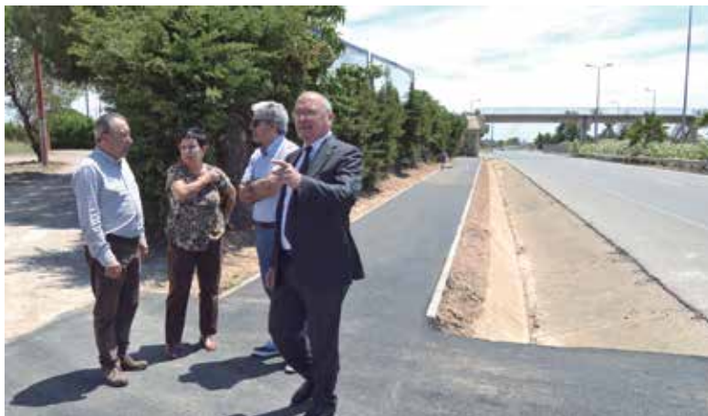
▲ Les autoritats al nou vial de l'Avinguda de Tarragona

L'obra ha estat executada per l'empresa del Gremi de la Construcció del Baix Camp, Tecnofirmes, amb un pressupost d'adjudicació de 35.880 euros. El projecte contribueix a la millora de l'avinguda de Tarragona, i s'afegeix a les millores exe-