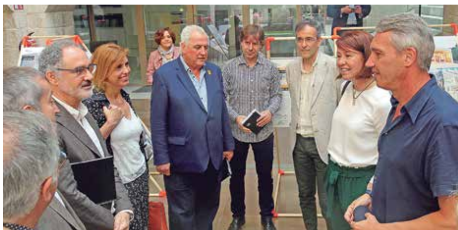
▲ Acte de presentació del nou observatori de la construcció de Girona

Arquitectes, promotors, aparelladors, la Universitat i els ajuntaments de Girona, Figueres i Olot s'uneixen