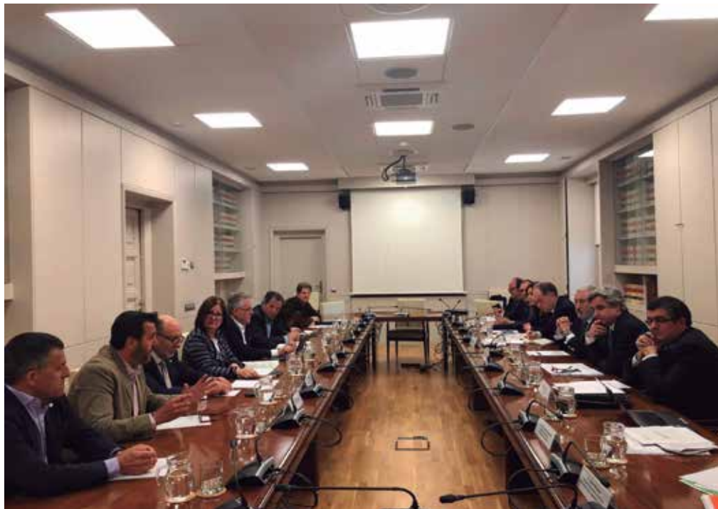
Reunió d'alcaldes de la Costa Daurada al Ministeri de Foment

Així ho va confirmar el secretari d'estat d'Infraestructures als alcaldes de Mont-roig del Camp, Salou, Cambrils i Vandellòs i l'Hospitalet de l'Infant