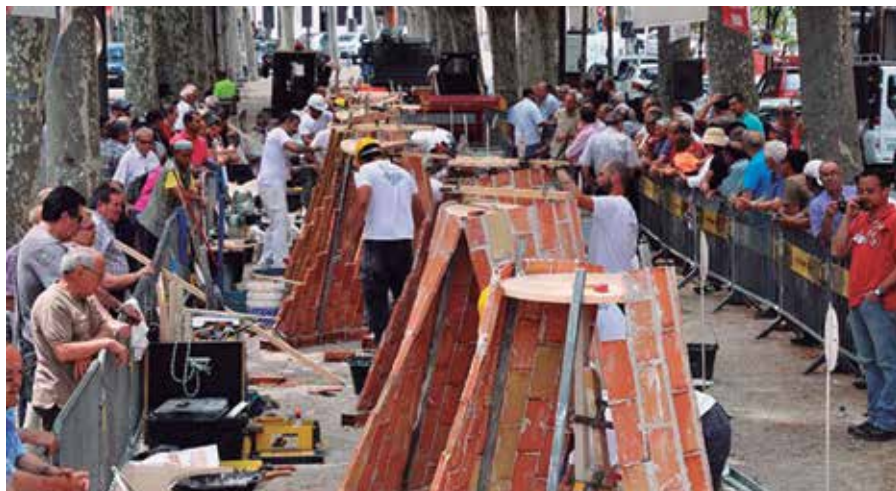
▲ Imatge del concurs de fa dos anys (45è Concurs)

Els principals actes de la festivitat tindran lloc el dissabte 9 de juny al Parc de Sant Jordi on enguany hi tindrà lloc la tradicional competició destinada a parelles