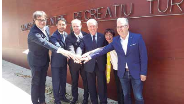
▲ Regidors i alcaldes de la Costa Daurada amb Damià Calvet

"Passarem de ser una gran destinació a Europa a una gran destinació al món". Amb aquesta ambiciosa expectativa i carregats de satisfacció, els alcaldes del territori han rebut amb molta alegria l'anunci de l'autorització de la llicència de casino per al complex d'oci Hard Rock Entertainment World, a Vila-seca i Salou. "Salou esdevindrà un referent de la marca Hard Rock a nivell mundial;